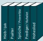
Lehrbücher / Psalmen