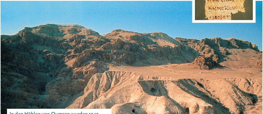
In den Höhlen von Qumran wurden 1947 zahlreiche Schriften aus der Bibel gefunden.