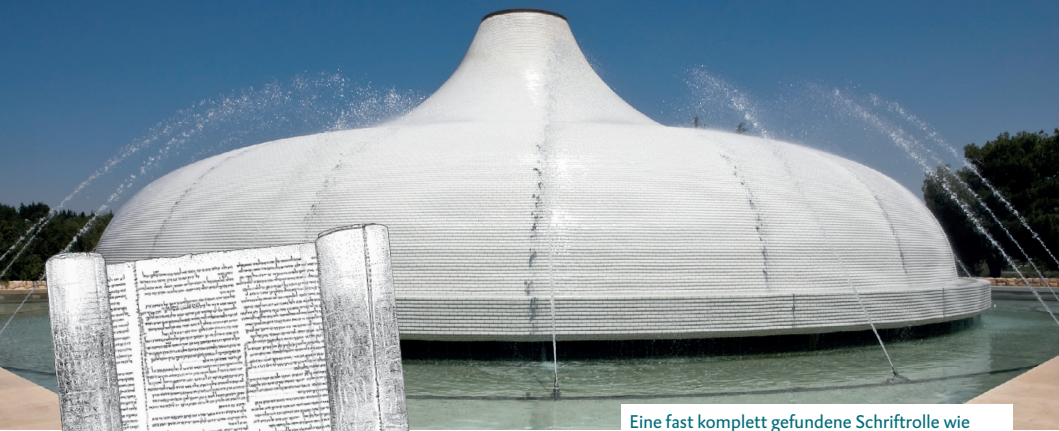
Eine fast komplett gefundene Schriftrolle wie hier Jesaja ist ein absoluter Glücksfall. Sie wird in Jerusalem im »Schrein des Buches« aufbewahrt.